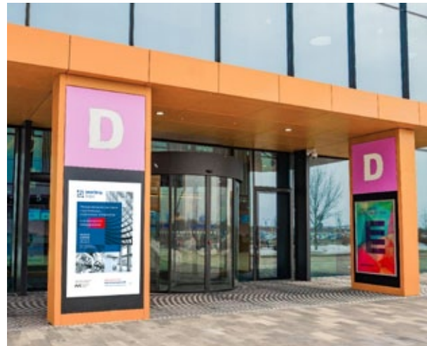
Рекламная конструкция входная группа, 1,15x1,75 м