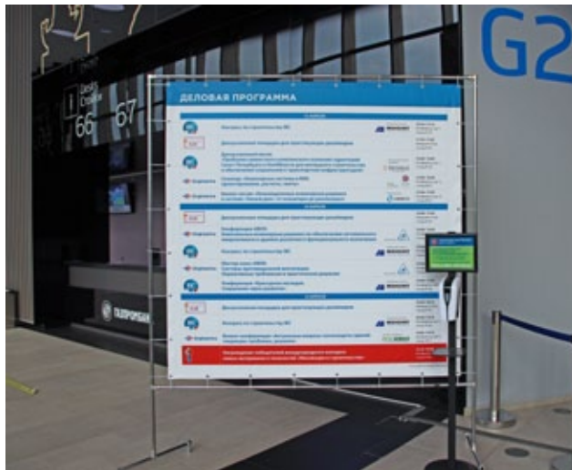
Конструкция 2x2 м

Рекламные конструкции разных размеров (одна сторона)