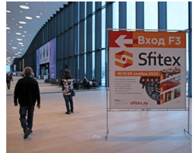
Конструкция 1,18x1,6 м