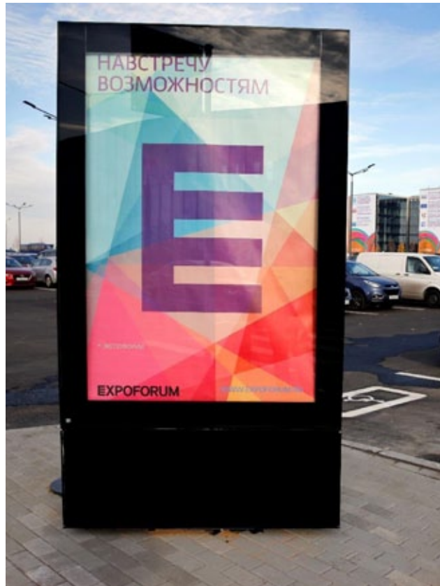
Лайтбокс, 1,2x1,86 м, на территории ВЦ