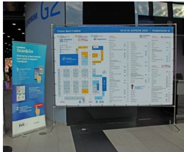
Конструкция 2,9x1,95 м