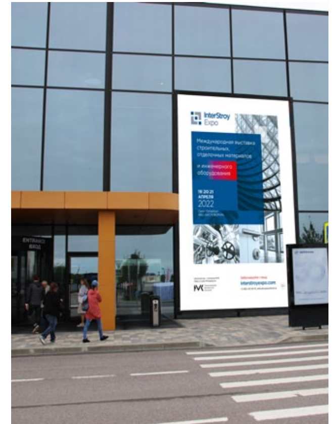
Реклама на части фасадного баннера, 4,8x4,24 м (полный размер фасадного баннера 5,24*9,36)